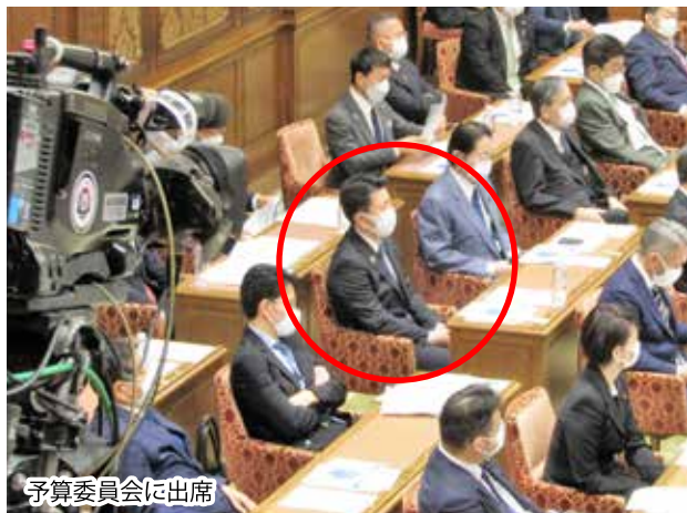
予算委員会に出席