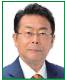
推薦 西田 実仁 (にしだ・まこと) 公明党参議院議員会長 参議院議員3期