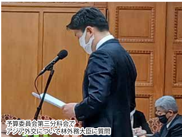
予算委員会第三分科会で アジア外交について林外務大臣に質問