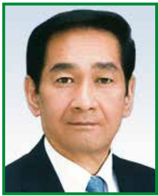
公認 関口 昌一 (せきぐち・まさかず) 自民党参議院議員会長 参議院議員4期