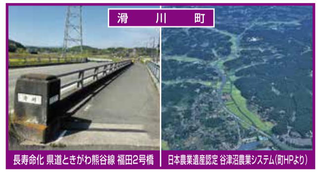
滑川町 長寿命化 県道ときがわ熊谷線 福田2号橋 日本農業遺産認定 谷津沼農業システム(町HPより)