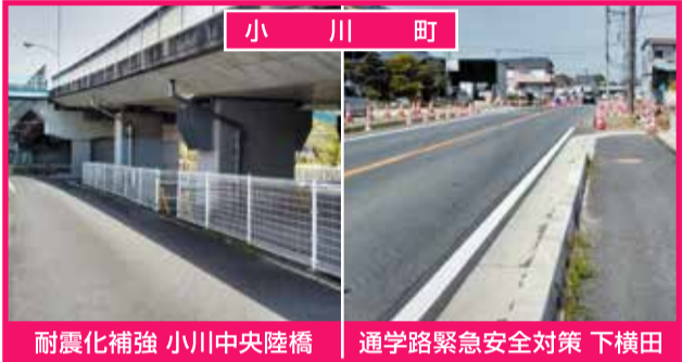
小川町 耐震化補強 小川中央陸橋 通学路緊急安全対策 下横田