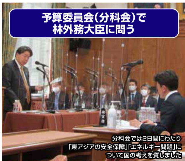
予算委員会(分科会)で 林外務大臣に問う