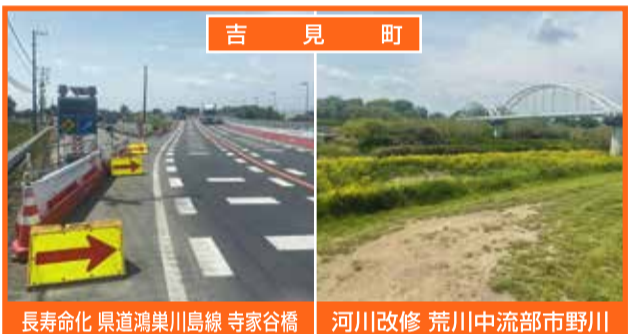
吉見町 長寿命化 県道鴻巣川島線 寺家谷橋 河川改修 荒川中流部市野川