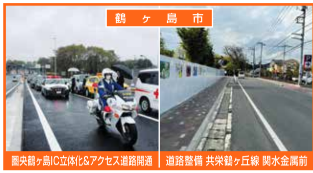
鶴ヶ島市 圏央鶴ヶ島IC立体化&アクセス道路開通 道路整備 共栄鶴ヶ丘線 関水金属前