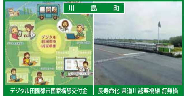
川島町 デジタル田園都市国家構想交付金 長寿命化 県道川越栗橋線 釘無橋