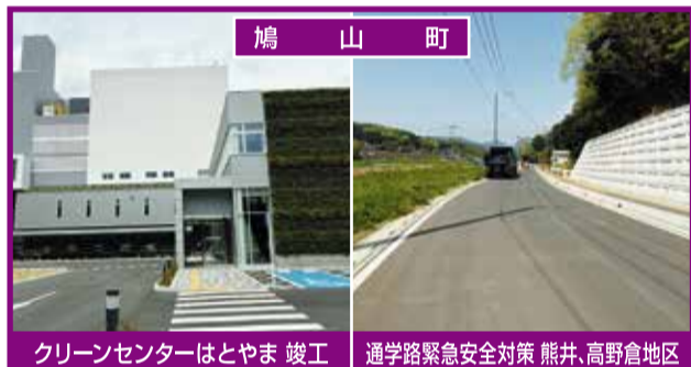
鳩山町 クリーンセンターはとやま 竣工 通学路緊急安全対策 熊井・高野倉地区