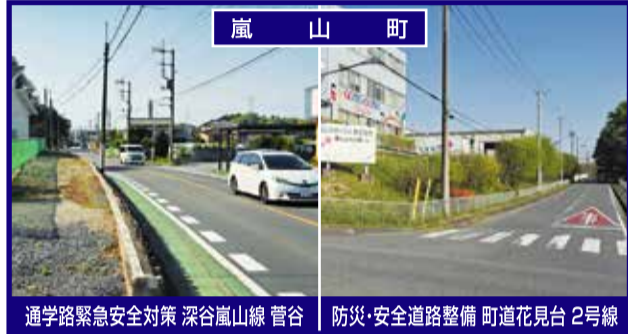
嵐山町 通学路緊急安全対策 深谷嵐山線 菅谷 防災・安全道路整備 町道花見台 2号線