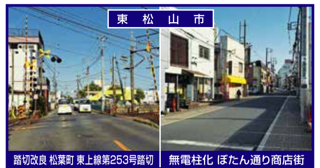
踏切改良 松葉町 東上線第253号踏切 無電柱化 ぼたん通り商店街