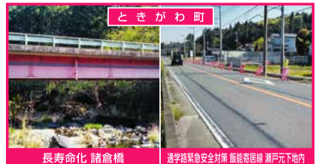
ときがわ町 長寿命化 諸倉橋 通学路緊急安全対策 飯能寄居線 瀬戸元地下内