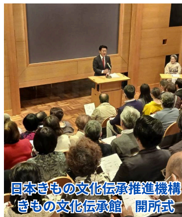
日本きもの文化伝承推進機構 きもの文化伝承館 開所式