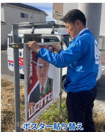
ポスター貼り替え