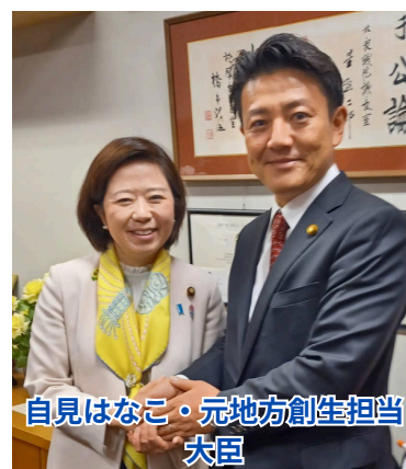
自見はなこ・元地方創生担当大臣