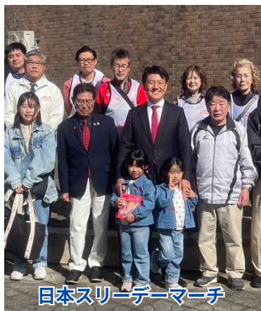
日本スリーデーマーチ