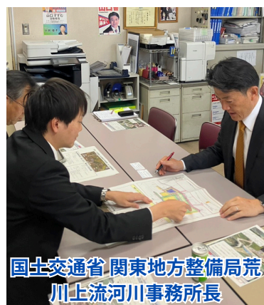
国土交通省 関東地方整備局 荒川上流河川事務所長