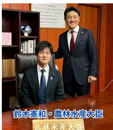
鈴木憲和・農林水産大臣