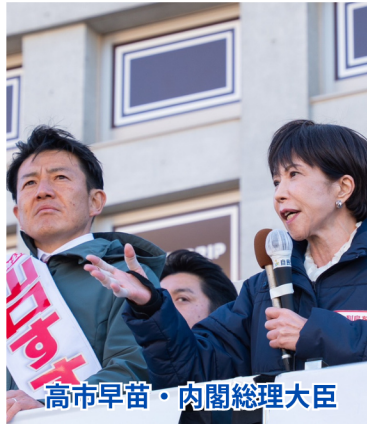
高市早苗・内閣総理大臣