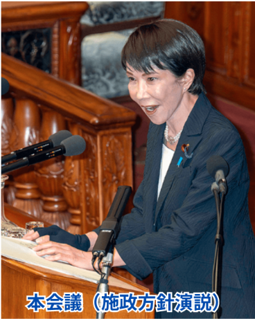
本会議（施政方針演説）