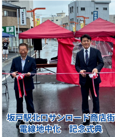
坂戸駅北口サンロード商店街 電線地中化 記念式典