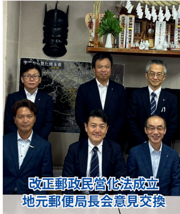
改正郵政民営化法成立 地元郵便局長会意見交換